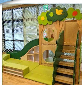
親子であそべるおへや